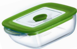
Plat carré 17 cm