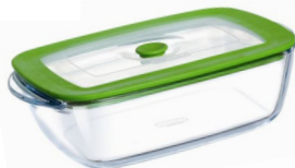
Plat rectangulaire 15x20 cm