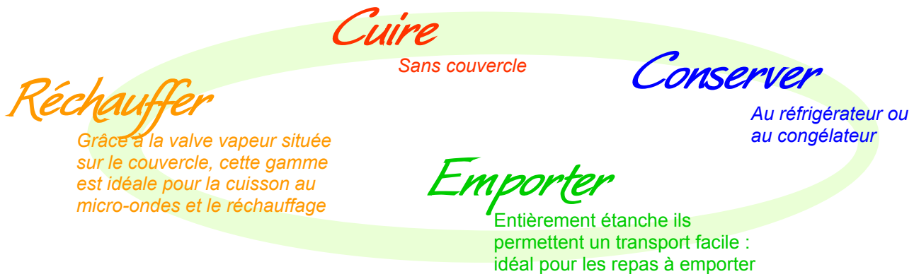
Bol 12 et 17cm

Des récipients 4 fonctions qui simplifient la vie de tous les amateurs de cuisine.